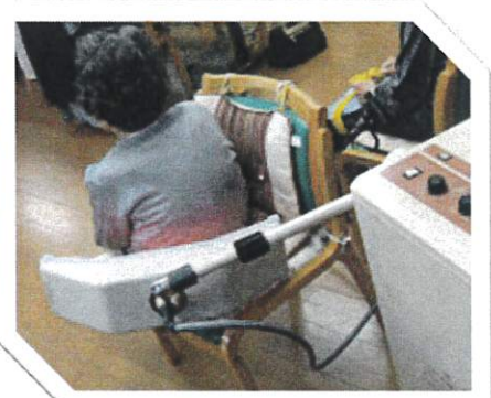
物理療法: ホットパック マイクロ、メドマー等