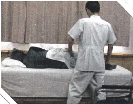
按摩・指圧師が行う 専門的なマッサージ