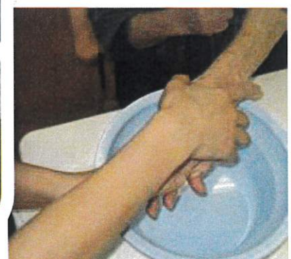
職員によるハンドマッサージ♪