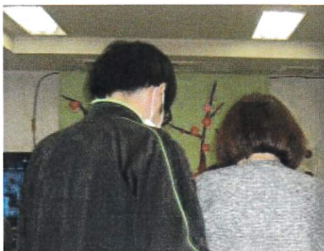
理学療法士がお一人お一人の 目標に合わせて個別機能訓練計画