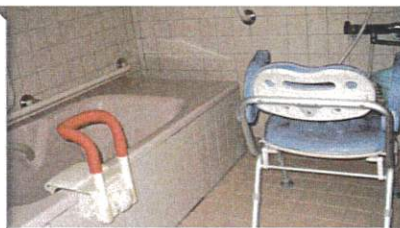
女性スタッフによる お一人ずつの個浴です♪