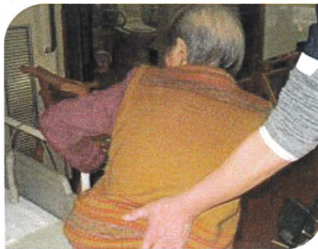
生活動作訓練 ベット移動練習中