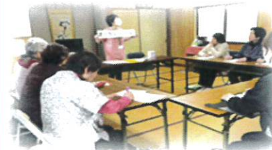
昨年、安芸区の保健師さんと一緒に「お口の健康講座」を開催させて頂きました 講師：歯科衛生士さん ※集会所で最後の活動となりました

地域の集会所で活動されていましたが、令和6年2月に集会所の利用を終了する事になってしまいました…しかし、メンバーにより様々な調整を行われ、3月から、空き家を使用して活動を始められました！！