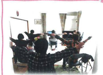
平成30年6月から活動の中に百歳体操取り入れておられます！

長く活動しているグループなのに、『場所がないから集まらない』というのは、さみしいなと思いました。今は住んでいない、私の自宅が活用出来るのならとの思いでお貸ししています。(家主様)