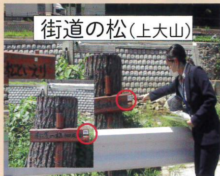
一般社団法人中国建設弘済会助成金による事業