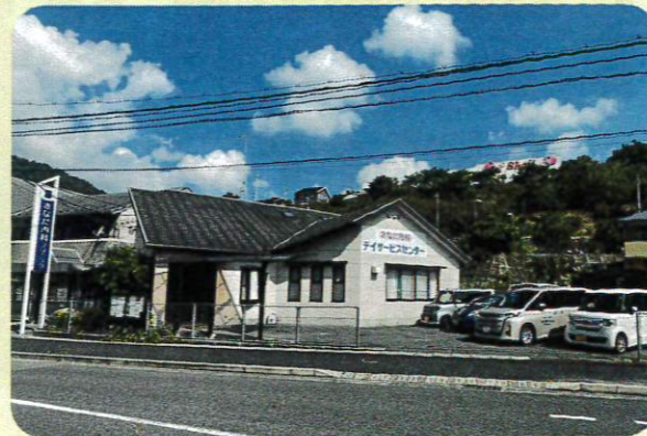
さなだ内科クリニック さなだ内科デイサービスセンター 外観