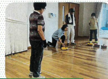
フロアカーリングの様子