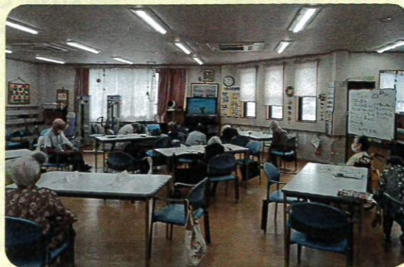
デイサービス利用中の風景です。 みなさんでテレビ体操されています。