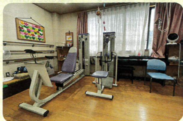
さなだ内科デイサービスセンターで使っているリハビリ器具です。