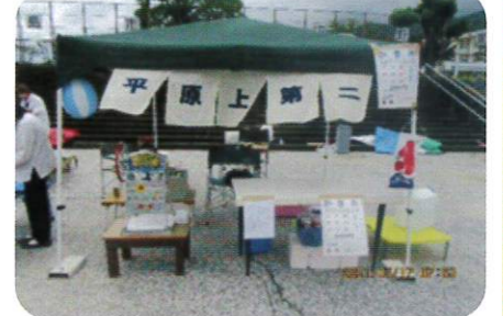
ほことり広場 野菜市