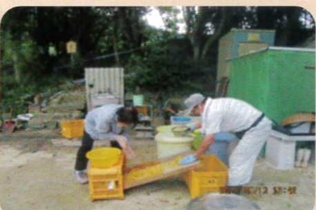
銀杏の実を洗い、洗って乾燥させます

悠遊きずな会では、朝6:30より大藤きずな広場にラジオ体操を行っています。 ※どなたでもご自由に参加ください!! いきいき活動ポイント事業対象 ※雨天中止