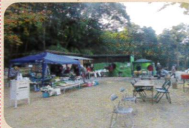
大藤きずな広場 収穫祭

悠遊きずな会では、朝6:30より大藤きずな広場にラジオ体操を行っています。 ※どなたでもご自由に参加ください!! いきいき活動ポイント事業対象 ※雨天中止