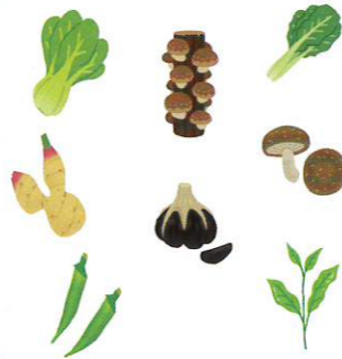
採れたて新鮮野菜

年末には餅をついたりしめ縄を作ったりし、お正月の準備をしています。土曜日には「ほことり広場」で丹精込めて作った採れたて野菜や健康茶の販売をしています。また、エブリイ海田店でも健康茶の販売を行っています。